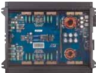
Vertrauen erweckend: viel Platz und sauberes Layout

Etons PA-Serie hat einen hervorragenden Ruf, den die PA 1502 in unserem Test verteidigen muss. Optisch klar als Vertreterin dieser Serie zu identifizieren, bestätigt sie ihren Qualitätsanspruch bereits im Inneren. Eine saubere, komplett SMD-bestückte Platine erfreut das Auge, die Elna-Kondensatoren im Netzteil sind für ihre klanglich positiven Eigenschaften hinlänglich bekannt. Auch ausstattungstechnisch weiß die Eton zu begeistern. Hoch- und Tiefpass sind gleichzeitig aktivierbar, was die Realisierung eines Bandpasses zulässt. Die untere Grenzfrequenz des Hochpasses ist zudem tief genug, um einen Subwoofer mit einem Subsonicfilter zu schützen.